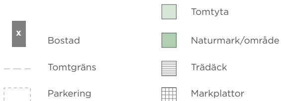
Illustration av terräng och vegetation, kan skilja sig från verkligheten